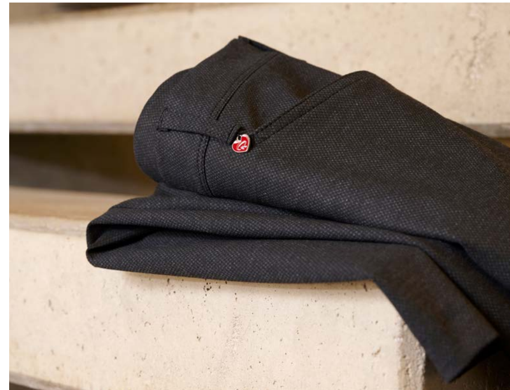
MbF Boot 67-16 / 2843-27 / 89