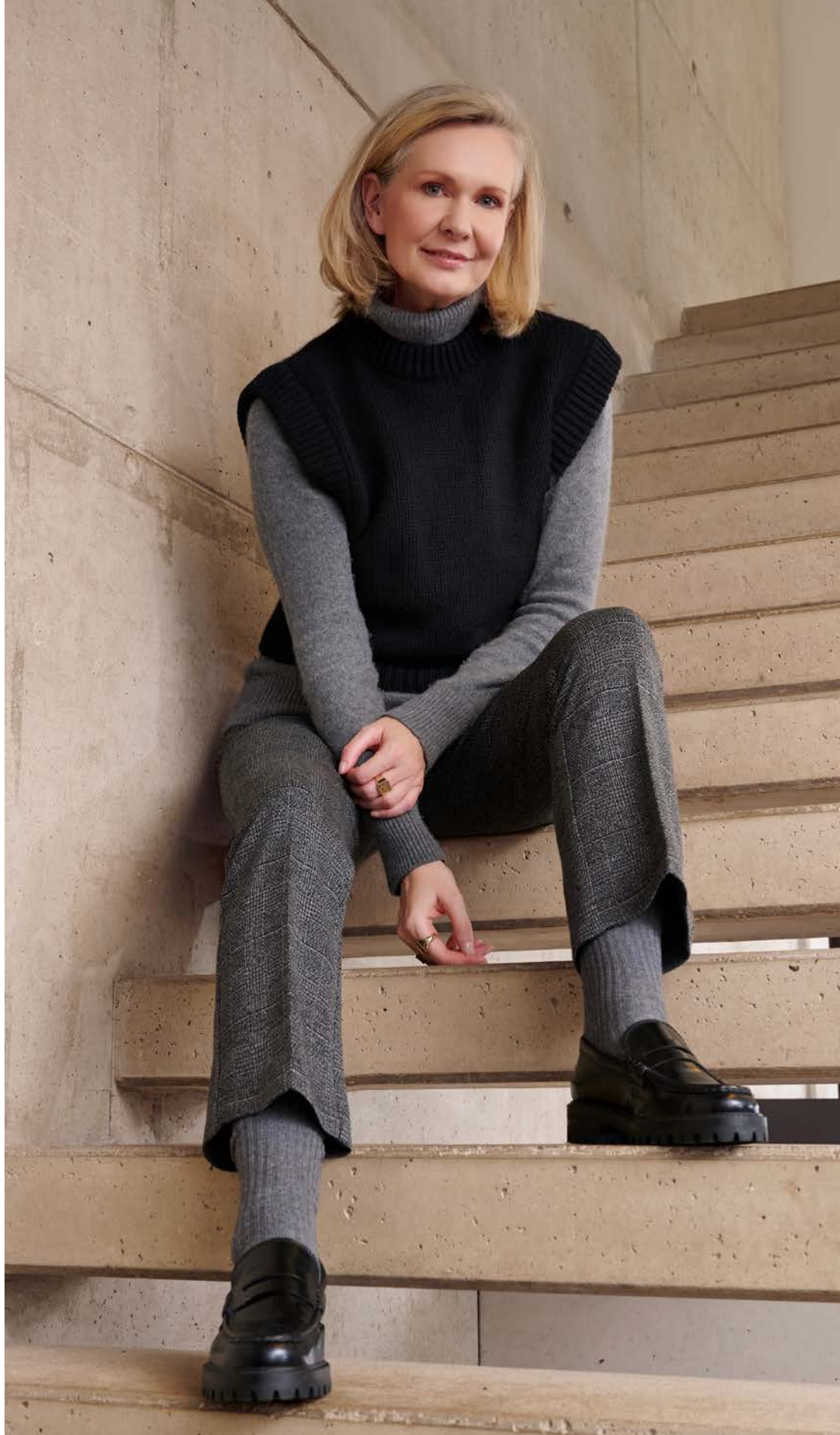
MbF Boot 67-06 / 2843-27 / 59